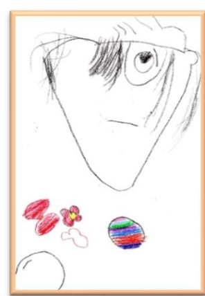
のどかちゃん・3歳